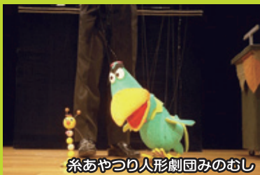
糸あやつり人形劇団みのむし