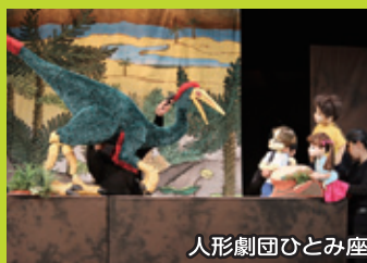
人形劇団ひとみ座