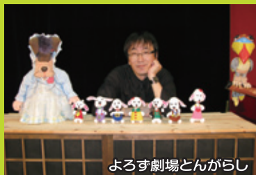
よろず劇場とんがらし