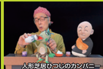
人形芝居ひつじのカンパニー