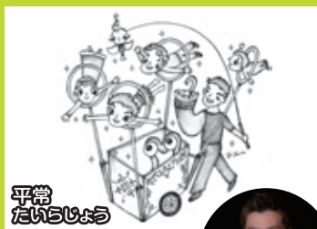
平常(たいらじょう)