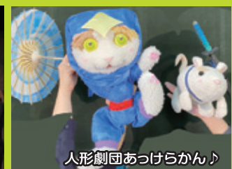
人形劇団あつけらかん♪