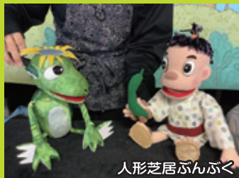
人形芝居ぶんぶく